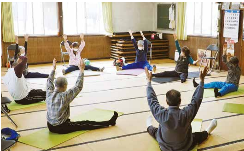
みんなで楽しくストレッチをする 芝スト班(塚沢支部)のみなさん

おひなさま月間の目標は、出資金と仲間増やしの年間目標達成です。 具体的な行動提起では、班会を開いて増資をお願いする、虹のボランティア行動リーフの活用、そして住所不明組合員の確認調査です。支部や班で様々な活動が行われました。