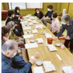
倉賀野支部の慰労会

3月23日倉賀野支部では、おひなさま月間取組みの総括と、支部班会への新旧者の入れ替えの紹介をかね、慰労会を行いました。初めにおひなさま月間進捗が報告され、出資金については出遅れていた今年度でしたが、3月になり目標達成可能であることが分かり、報告を受けました。コロナ禍で活動が制限される中での結果であり、来季に向け朗報となりました。 当日も出資金が集まり、最後になってWBC顔負けの9回裏の逆転劇で目標達成することができました。次年度への弾みがつかまりました。