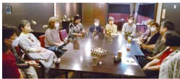
参加者も増えました

10月6日の午後、通町診療所利用委員会主催のおしゃべりカフェを鞘町のcafeあすなる2階のフリースペースで開催しました。