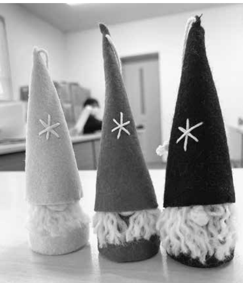
2024年のクリスマスプレゼントはかわいいサンタ。