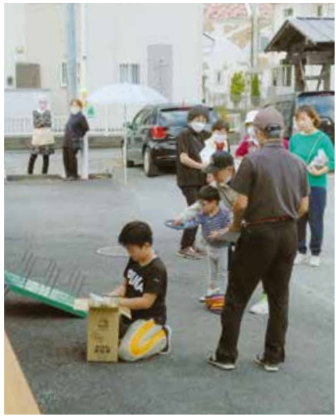
子どもたちも大喜び

10月28日、江木北公民館で江木支部のミニ健康まつりが行われました。支部の皆さんが作った野菜や手作り品のバザー、ゲームコーナー、そして健康チェックと盛りだくさん