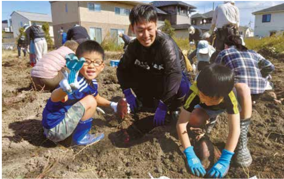
子どもたちも楽しんでサツマイモを掘りあげました

組合員の皆様へ。住所や氏名が変わったとき、組合員がお亡くなりになったときには、下記にご連絡ください。組合員活動部 ☎027(323)2762