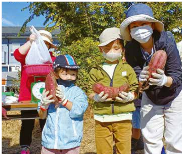
重さコンテストにエントリーした親子での参加者

ぶんが糖に変わり甘くなるとの事です。ぜひ、追熟させてお召し上がりください。当日に食べて甘みはな