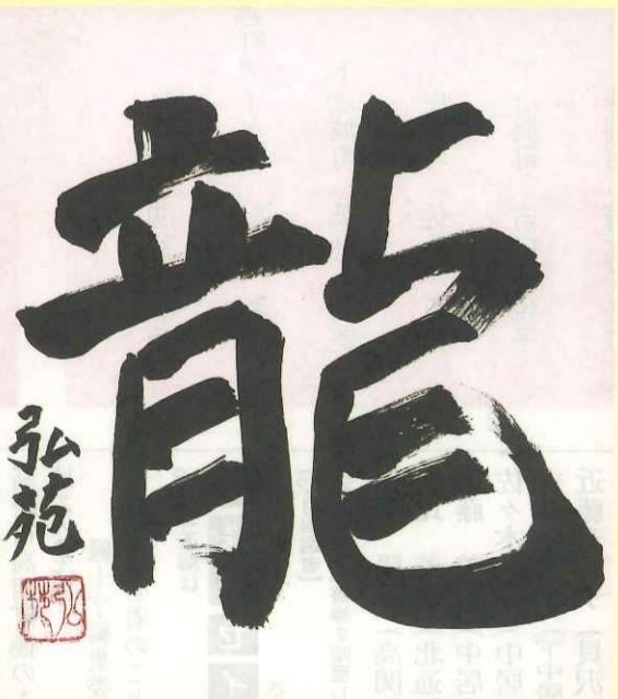
書道 菊池 弘美(下之城町)

を開催しています。地域の方達と連携を図り、利用者の方達が地域の方達と笑顔で交流が出来るよう協働してまい