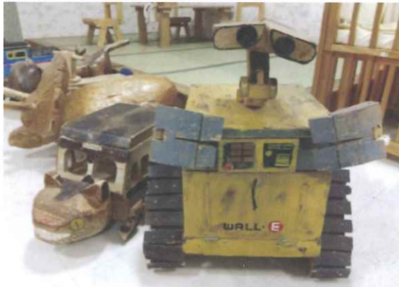
小児科で子どもたちを和ませる木工細工