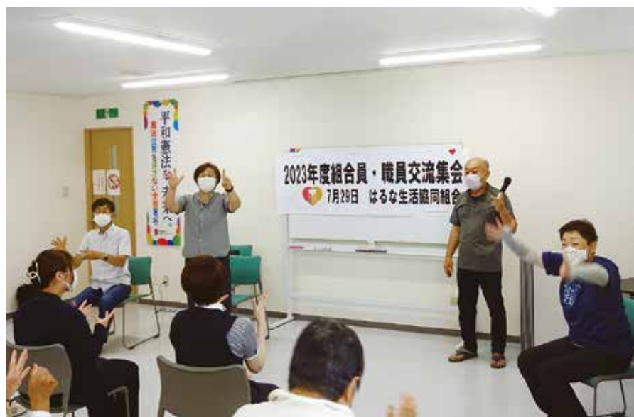
はるな健康体操の実演

生協の活動をもっと知ってもらおう事が大事。そのためには活動を復活させる必要がある。