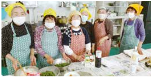
知恵袋班のみなさん

コロナ禍で中止していた班会を4月から再開しました。季節の野菜を活かして、医療福祉生協連