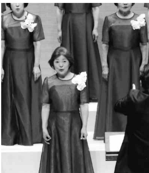
2022年4月9日 双葉会コンサート

あーちゃん 歌で元気に 若い時から歌は好きでしたが、40歳頃親子合唱団に出会い、娘と一緒に歌いました。 娘が卒業し一時は夫と、そして又孫とも歌えました。とても素敵な組曲を歌う合唱団でした。団長のピアノがごんごん引張って来てくれてコンサートも盛り上がり楽しい時間でした。 その後、縁あってバリトン歌手の先生が指導される合唱団と出会い、今