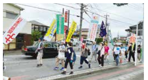
元気に行進する参加者のみなさん

今年も夏の平和行進の季節がやってきました。7月14日に高崎メインコースが行われました。曇り空の一時小雨が降る中、集会には全体で約60人が参加、はるな生協からは、組合員と職員の計15人が参加しました。行進途中では、昨年同様に沿道からのアピール宣伝を行い、特に北高崎駅周辺では、女性団体の皆さんと一緒に核兵器廃絶を沿道の人達に訴えました。行進は、今回もお昼休憩会場だった井野公民館(井野町)で終了。その後は、事務局が車でパレードしながら前橋市役所で無事に前橋行進団に引き継ぎました。