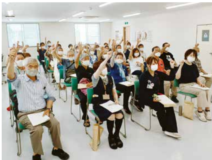
会場いっぱいとなった組合員・職員交流集会 (組合員ふれあい会館2階)

グループワークは6人〜7人で行われました。自己紹介からは始まり、日ごろの生協への要望、質問など、また班会メニューについての要望なども活発に議論されました。