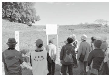
歴史巡りはフレイル予防

ガイドさんから古墳の歴史や種類の説明、伝承の民話や逸話などの紹介を受け、大鶴巻古墳に登って見晴らしのよさに感激。林西寺・安楽寺のそばを通りながら、古墳時代から江戸時代までの歴史を学びました。