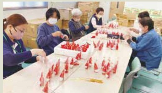
今年のプレゼント袋詰め