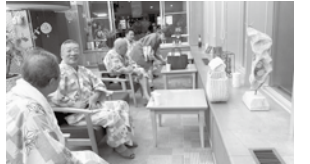
温泉でゆったりと

第5支部では、月間で班会を開催し今後は参加者を増やして活発な活動を目指しています。