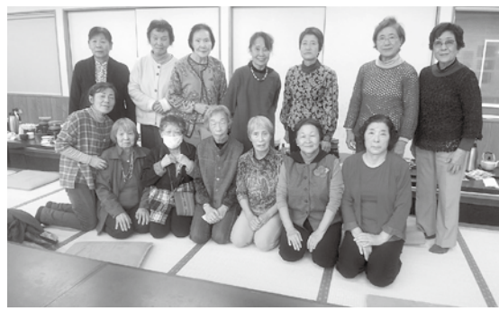
毎年楽しみな恒例行事です

11月14日に15人の参加で相間川温泉(倉淵町)に出かけました。湯呑の後は、名物の釜めし御膳のランチ。おこげもおいしく大満足。畳の縁で作ったバッグ等の豪華景品の当たるビンゴゲームや歌、体操をして小春日和の一日を楽しみました。