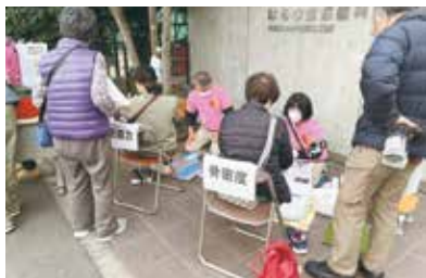
健康チェックコーナー

あおば薬局高崎店さんが「お薬相談」、社会保障委員会は「マイナ保険証Q&A」また「能登半島豪雨災害」の募金箱も設置しました。