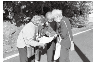
地図で訪問先を確認

役員と理事、組合員活動部職員の5人で、地図を見て作戦会議ののち、ポストにチラシを入れていきます。「新しい家が増えたね」、「ここの方も組合員さんだったのね」などと話しながら26軒ほど配りました。