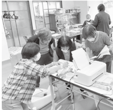
骨密度測定の結果は気になるね