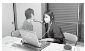
エコー検査でチェック

ニコニコと戻って「わたし血管美人」と言う人もいれば、「少し血管の壁が厚くなっているみたい」という人もいました。