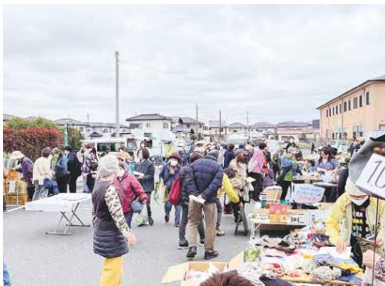
模擬店が並び賑わう会場＝歯科診療所駐車場

組合員の皆様へ。住所や氏名が変わったとき、組合員がお亡くなりになったときには、下記にご連絡ください。組合員活動部 ☎027(323)2762