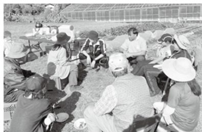
円陣で休憩・景色も最高