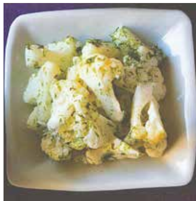
<1人分の栄養価> 44kcal 塩分0.3g