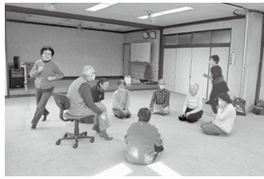
楽しいと元気が出るね

11月13日のカワセミ班会は10人の参加。体操で体をほぐしてから、移動じゃんけん、ハンカチ(タオル)落とし。「輪を小さくすると目が回るね〜」と途中から逆回りにしてみんな真剣に走りました。その後、脳トレで間違い探し、歌集から季節の歌を選び合唱と盛りだくさん。和気あいあい楽しい班会です。