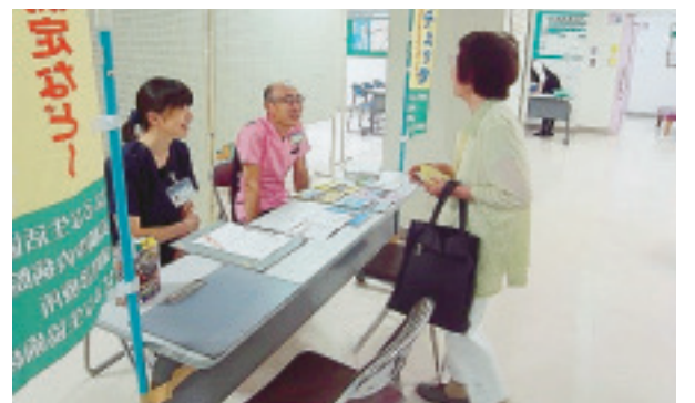
街かど健康チェック