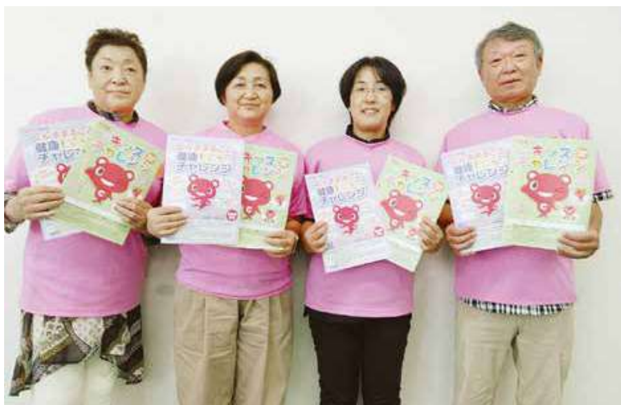
アピールする健康づくり委員のみなさん