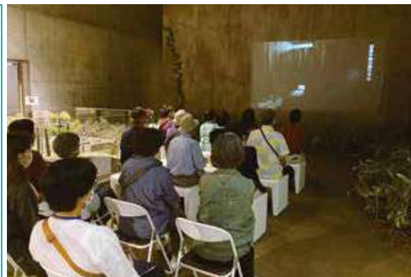
重監房資料館で映像を見る参加者

5年ぶりに第36回上州歴史散歩(8月6日)を園々人権について学ぶの企画に15人が参加しました。栗生楽泉園 重監房資料館を見学し芸員の方にお話を聞きました。重監房資料館にはその1室がほぼ当時のように再現されており、中に入ることもできませんでした。4、5人で狭い入口から中に入り夜を再現した室内、「数分も居られない恐怖だ」と参加者の声。重監房跡地にも足を運びました。うつそうとした林の中に建物の基礎が見学用に整備されていました。「自分は差別をしていないだろうか」「権力の恐ろしさ、時代の恐怖を感じた」など参加者の感想がありました。