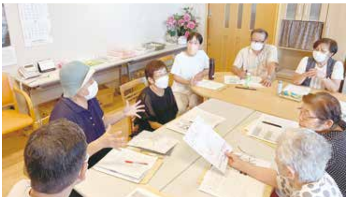
語り合った交流会(グループディスカッション)

③ 睡眠時無呼吸症候群(SAS) 検査の利用 ② 健診受診の利用 ① 予防接種の利用