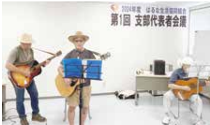
演奏するビレッジフィンガー5

② 様々な取り組みに新し ① はるな生協の事業の魅力を知ってもらい、事業利用を高める