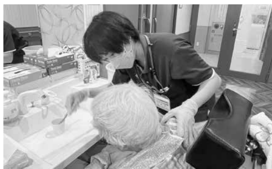
利用者さんの対応にも慣れました

現在、「デイサービス虹の家」で働いています。性格は人なつこい方で、子どもさんを2人残して働きにきています。