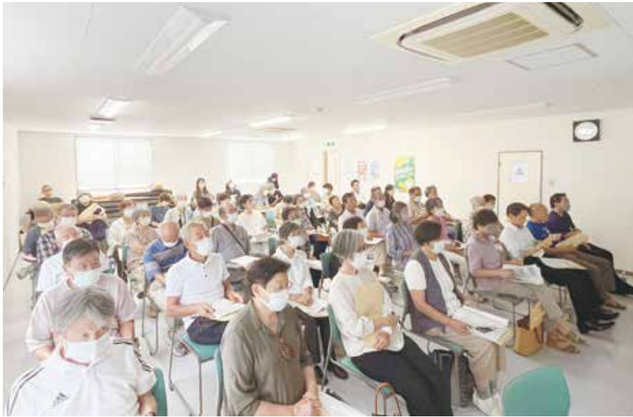
生協強化月間の説明を聴く参加者のみなさん

組合員の皆様へ。住所や氏名が変わったとき、組合員がお亡くなりになったときには、下記にご連絡ください。組合員活動部 ☎027(323)2762