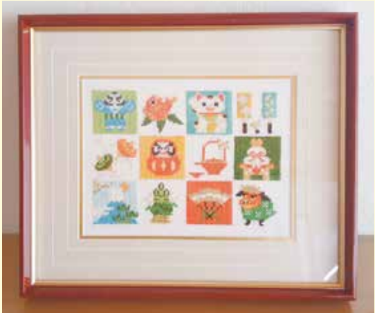
フランス刺繍（貝沢町）