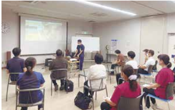
2025. 9月事業所内 学習会の様子

倒産件数も12年ぶりの高 水準という話もあり、日 本全体の構造的 な課題なのかも しれません。ビ ジネスの分野で はよくミッショ ン・ビジョン・ バリューなどと 言いますが、法 人としての存在 意義や社会的使 命がどこにあっ て、そのために 何をすべきか、 そうしたことが 改めて問われて