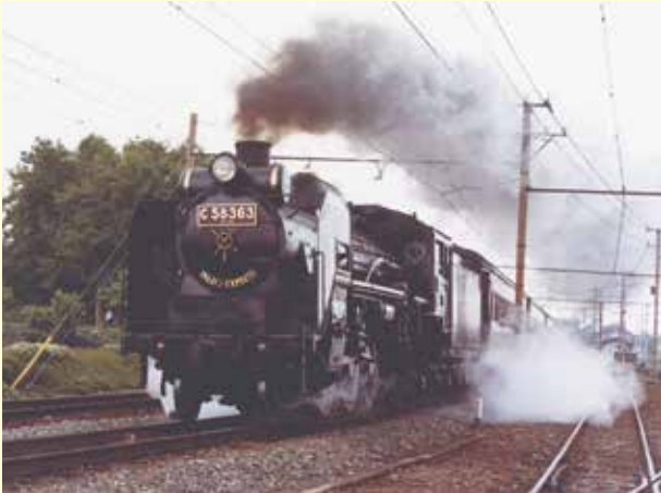
上州路を走るSL C58（上中居）