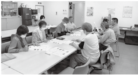
議案説明会 5/21 (群馬町・塚沢・第5支部)