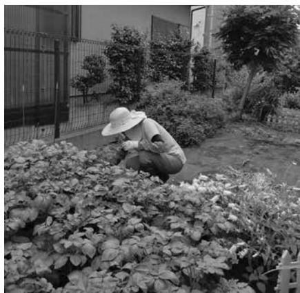
ジャガイモ畑の草とり

はるな生協の介護施設「虹の家」の南側に庭があります。桜・蠟梅・みかん・金木犀などの木が植えられています。花や野菜も育てられます。私はボランテニアで草むしりをして、今はジャガイモの収穫が楽しみです。開設当初は、利用者さんや職員さんが野菜や花を育てていましたが、今は 業務が忙しくなかなかできないようです。木の剪定をしてくれるボランティアさんもいます。夏は暑くて大変ですが、少しでもきれいな庭を保てるよう出来るだけ長く続けていきたいと思っています。